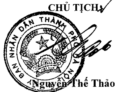
Nguyễn Thế Thảo